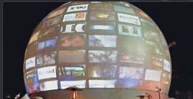
Direct TV - FireFly LA

Als besonderes Highlight bietet coolux eigene SDI-Inputkarten für Live-Video-Signale mit besonders niedriger Latenz. Diese verarbeiten SD und HD SDI in einer Größenordnung von 2 Frame-Puffern. Die Pandoras Box Produkte bieten einen Echtzeit-Deinterlacer um Kamera-Halbbilder bei voller Framerate zu darzustellen.