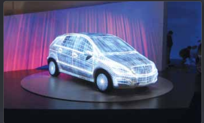
Mercedes B-Class Launch - China