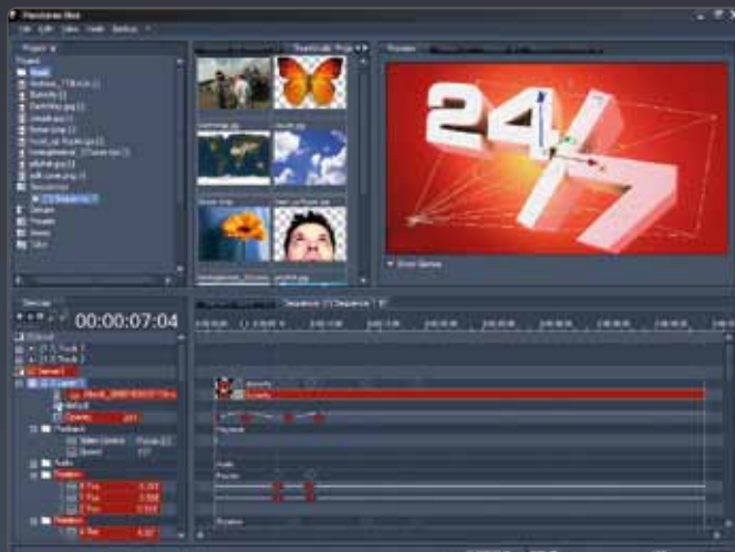
Screenshot User Interface

Das einfache Handling von Farbkorrekturen, individueller Positionierung und dem freien Arrangieren von Videos und Bildern bietet viel Spielraum für kreative Projektionsgestaltung. Zudem bieten die Pandoras Box Server die Option, Videodaten zu synchronisieren oder 3D Objekte wie Logos oder Produkte zu animieren.