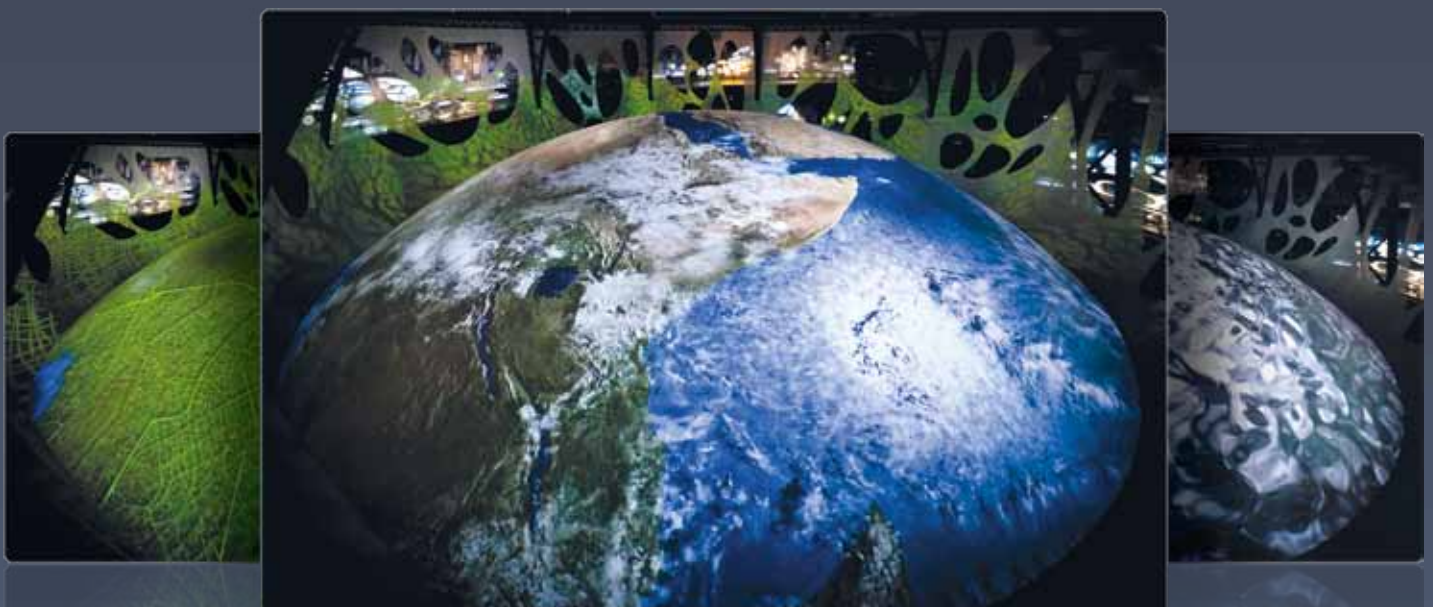
BLUE PLANET SHANGHAI EXPO - courtesy of TRIAD

Über das Softedge- und das Warping-Feature können flache oder verformte Flächen mit mehreren Projektoren bespielt werden. Jeder Ausgang kann unabhängig eingestellt und gesteuert werden, um sowohl horizontal als auch vertikal nahtlos zu einem großen Bild ineinander geblendet zu werden.