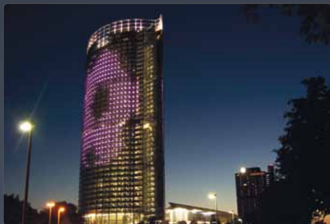
DMX Matrix - Post Tower Bonn

Pandoras Box Systeme bieten einen High Definition-Wiedergabemodus, mit einer maximalen Auflösung von bis zu 4K. Der integrierte HD Mpeg Encoder ermöglicht es, ganz nach den Anforderungen Ihres Projekts sowohl den mitgelieferten Content als auch individuell gewünschte Auflösungen in das richtige Format zu konvertieren.